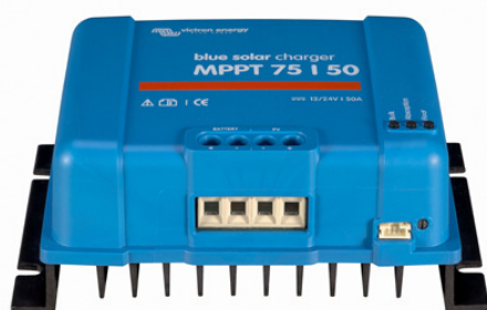
Controlador de carga solar MPPT 75/50